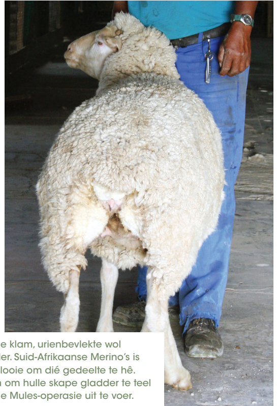
'n Skaap wat gemikskeer is om die klam, urienbevekte wol rondom die agterstewe te verwyder. Suid-Afrikaanse Merino's is deur die jare geteel om minder plooië om dié gedeelte te hê. Australiese boere het reeds begin om hulle skape gladder te teel sodat dit onnodig sal wees om die Mules-operasie uit te voer.

Diereregte-aktiviste in Australië het besluit om die kwessie weer op te neem en het Australiese boere tot 1 Januarie 2014 gegee om die operasie te staak ten einde verdere veldtogte af te weer.